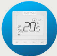
Termostat inteligent IT700