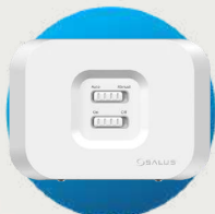
WZ600 Receptor WiFi Zigbee