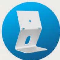
Stație de andocare (disponibilă separat)